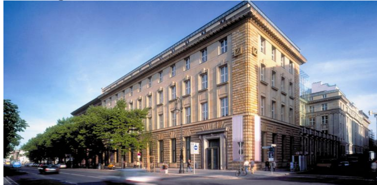
Deutsche Guggenheim, Unter den Linden, Berlin.