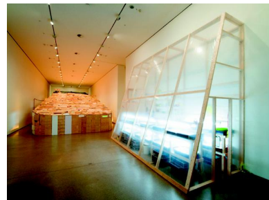
1998 James Rosenquist: The Swimmer in the Econo-mist 2002 Bill Viola: Going forth by day