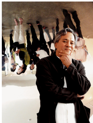
Porträtaufnahme Anish Kapoor Foto: Ji-young Lee, 2003