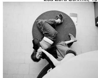
Rachel Rabhan: Dream Warriors: Jacob vs. The Angel, 2005 © Rachel Rabhan