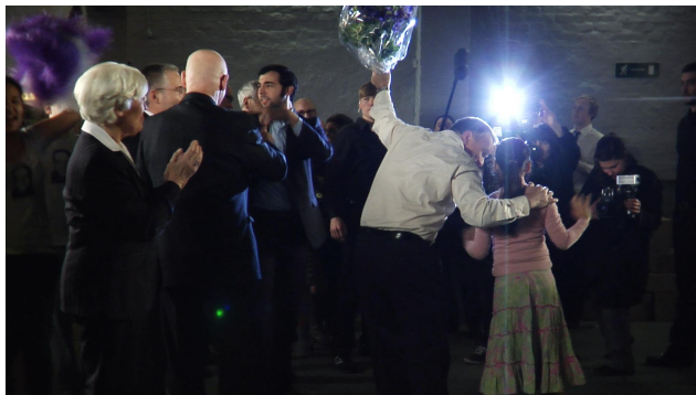
©: Clemens von Wedemeyer: Die Probe (filmstill)

Bank den Verein der Villa Romana und das 1905 von Max Klinger mitbegründete Künstlerhaus. Mit der Schau im Deutsche Guggenheim findet diese Kooperation einen neuen Höhepunkt und setzt zudem die Reihe der von der Deutschen Bank konzipierten Ausstellungen in dem Berliner Joint Venture mit der Solomon R. Guggenheim-Stiftung fort. Freisteller dokumentiert, wie sich eine traditionsreiche Institution abseits der großen Metropolen als kreativer Think-Tank der Gegenwartskunst und Ort des interkulturellen Austauschs profiliert. Dass die Preisträger der Villa Romana nun erstmals im Deutsche Guggenheim präsentiert werden, setzt Zeichen. Denn durch die Vernetzung beider Häuser wird ein öffentlichkeitswirksames Forum geschaffen, das die vitale, international agierende Szene in Deutschland authentisch widerspiegelt.