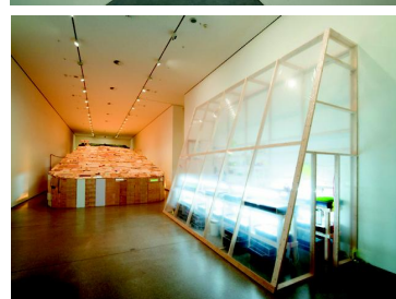
2005 25 Jahre Sammlung Deutsche Bank 2007 Phoebe Washburn: Regulated Fool's Milk Meadow

wurde, standen in Berlin nicht nur die jüngsten Fotoarbeiten des kanadischen Kunststars im Mittelpunkt. Es galt auch das Jubiläum eines weltweit einmaligen Projekts zu feiern. Als die Deutsche Bank und die New Yorker Solomon R. Guggenheim Foundation vor zehn Jahren ihr Joint Venture begründeten, war dies ein bahnbrechendes Modell mit einem außergewöhnlichen Konzept: Mindestens eine der vier jährlichen Ausstellungen entsteht als Auftragsarbeit.